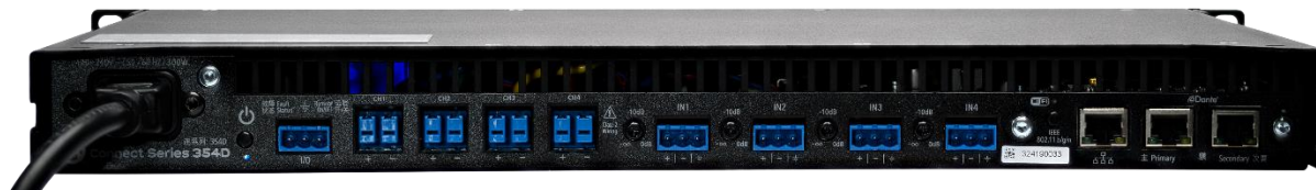
Connect 354D 背面