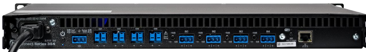
Connect 354 背面

Connect シリーズは、小規模から中規模の施設に適したパワーアンプです。2/4/8ch のラインナップで、それぞれに Dante 搭載モデルがあります。ローインピーダンスまたはトランスレス接続できるハイインピーダンス(70V/100V)の接続が可能で、各チャンネルごとに切り替えができます。Analog Devices 社製 96kHzDSP を搭載し、最大 48dB/Oct のクロスオーバーフィルター、8 バンド PEQ、スピーカー保護リミッターなど、多彩な機能を搭載しています。アンプへの接続には、内蔵の Wi-Fi アクセスポイントを使用する、既存 Wi-Fi ネットワークから接続する、または高速 10/100MB イーサネット接続する、の 3 つの方法があります。ソフトウェアのダウンロードが必要なく、Web UI で PC やモバイルデバイスからリモートコントロール、監視、通知など、多様な制御が可能です。さらに、クラウドからの接続も可能です。Connect シリーズは、LEA Professional Cloud(2020 年サービス開始)に対応した初めてのプロフェッショナルパワーアンプシリーズです。LEA Professional Cloud と Web UI を使用することで、監視や予防のシステムメンテナンスを遠隔で行うことが可能です。